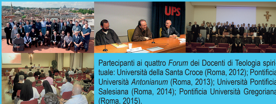
Partecipanti ai quattro Forum dei Docenti di Teologia spirituale: Università della Santa Croce (Roma, 2012); Pontificia Università Antoniana (Roma, 2013); Università Pontificia Salesiana (Roma, 2014); Pontificia Università Gregoriana (Roma, 2015).

Consapevoli che si apre un vasto panorama, vogliamo prendere il largo, abbandonare la spiaggia ed inoltrarci nel mare.