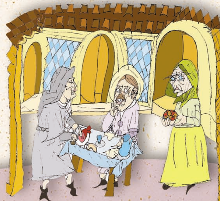
“Dar da mangiare agli affamati” - disegno di Marianna Caprioletti